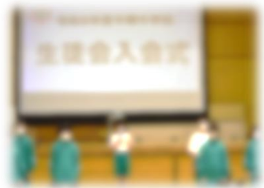
R8 生徒会入会式の様子

学校HP: https://www.nakago-jjorne.ed.jp/otayori/